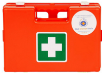
Complete verbandkoffer Richtlijn 2016