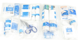
Vulling Verbandkoffer Richtlijn 2016