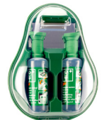
NACL oogspoelstation 2x 500 ml flessen

Dit is slechts een kleine selectie van ons BHV & EHBO assortiment. Kijk voor meer informatie op sosbhv.nl