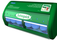
Pleisterautomaat Makkelijk & hygienisch